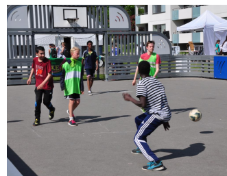
Foto af streetsoccer og streetart

4 drenge fra Skelagergårdene med navnet öIskolde Kebasö vandt soccerturneringen. (På billedet til venstre spiller de Basket i grønne trøjer.)